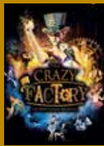
14 FÉVRIER Spectacle Saint-Valentin