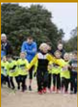
2 FÉVRIER Cross des Familles

Vœux du maire à la population le 18 janvier 2019 à 18h